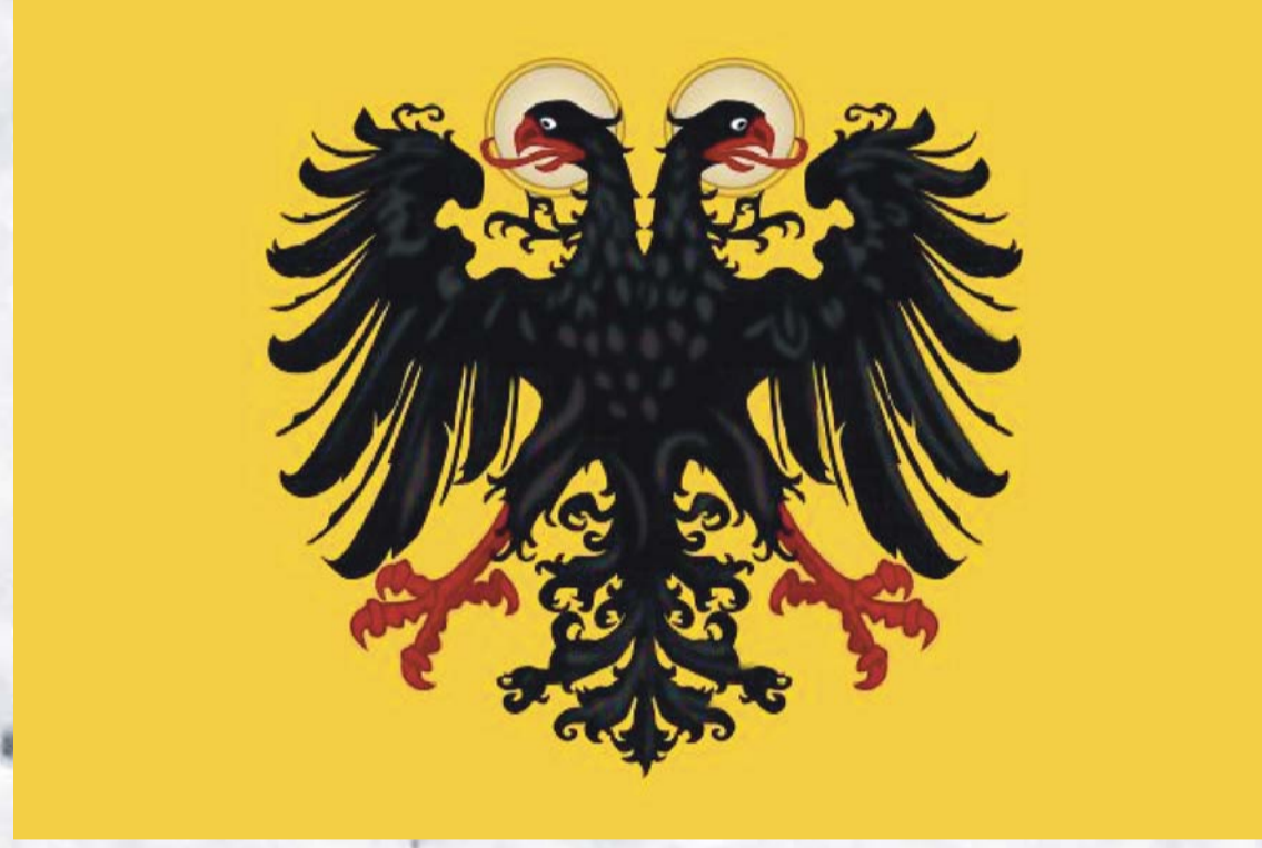
Roma İmparatorluğu 1512-1806 Heiliges Römisches Reich (Deutscher Nation) 1512-1806 Holy Roman Empire (of the German Nation) 1512-1806

Siyah-beyaz-kırmızı veya siyah-kırmızı-altın rengi ? Schwarz-weiß-rot oder schwarz-rot-gold ? Black-White-Red or Black-Red-Gold?