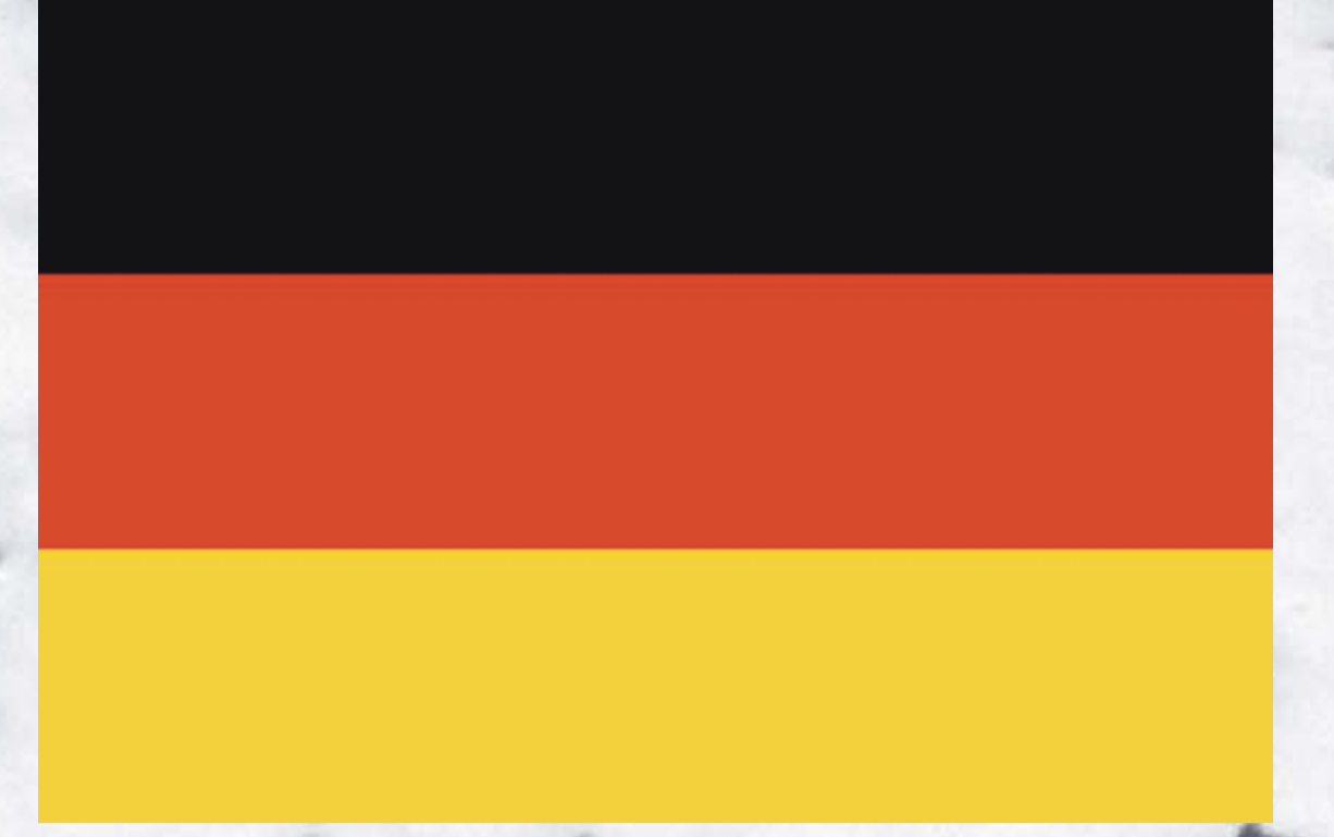
1949 yılından bu yana kullanılan Alman bayrağı Bundesrepublik Deutschland seit 1949 German Federal Republic since 1949

Siyah-beyaz-kırmızı veya siyah-kırmızı-altın rengi ? Schwarz-weiß-rot oder schwarz-rot-gold ? Black-White-Red or Black-Red-Gold?