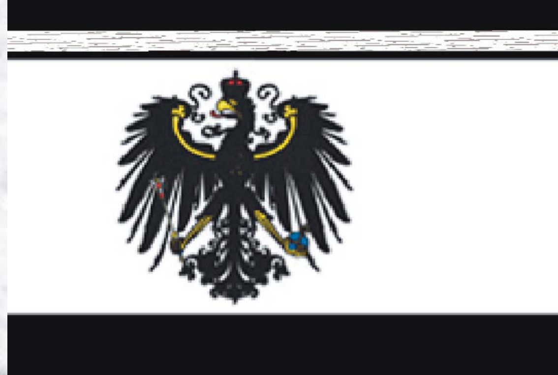
Prusya Krallığı Königreich Preußen Kingdom of Prussia

Ortaçağ'dan bu yana Germen İmparatorluklarının mübarek renkleri siyah ve altın rengi kabul edilirdi. 1813 yılında Napolyon'a karşı yapılan barış muharebelerinde Almanlar siyah kırmızı altın renklerini kullanırlardı. Prusya krallığına ise siyah ve beyaz renkleri hâkimdi. 1871 yılında Prusyalılar hâkimiyetinde Alman devleti kuruldu. Böylelikle siyah beyaz kırmızı renklerini aldı. Birinci dünya savaşı sonrasında demokrasi ön plana çıkmaya başladı. Siyah kırmızı altın renkleri tekrar seçildi. Nasyonal sosyalistler bu renkleri istemiyordu. Bu yüzden 1933-1945 yılları arasında siyah beyaz kırmızı renkleri kullanıldı. İkinci dünya savaşından sonra ise Alman bayrağı siyah kırmızı altın rengini aldı.