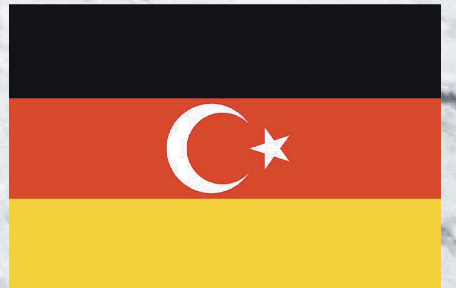
Türk-Alman bayrağı (resmi olmayan)

Türk kökenli insanların yeni memleketlerine olan bağlılıklarını sembol eder. .