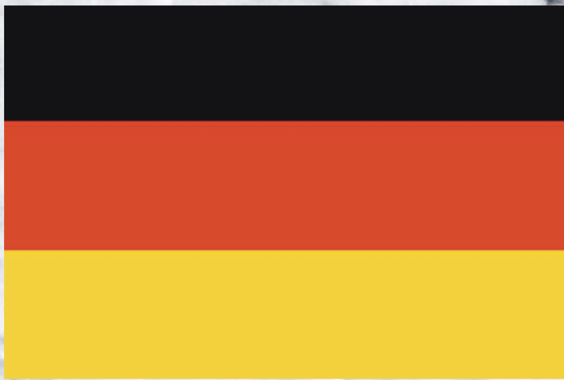
Deutsches Reich 1933-1945 Deutsches Reich 1918-1933 German Republic 1918-1933

The flag colors of the Holy Roman Empire of the German Nation since the Middle Ages were black and gold. Germans wore these colors during the freedom fighting against Napoleon 1813. The Prussian Kingdom had the colors black and white. 1871 under the leadership of Prussia the German Reich was founded and the colors black, white and red were used. After WWI, Germany became a democracy. The new combination of colors was black, red and gold. National Socialists didn't want these colors and favored the colors black, white and red between 1933 and 1945 as German colors. After the end of WWII Germany retained the color combination of black, red and gold.